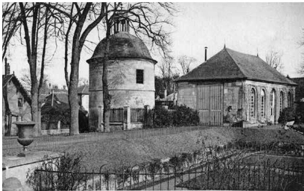
4. HOSPICE DE BRÉVANNES — Le Pigeonnier et l'Orangerie du Château

Vous pourrez également retrouver des panneaux explicatifs sur ces mêmes éléments dans le cadre d'une promenade au cœur de la Ville.